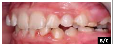
Рис. 5. Фотографии окклюзии и зубных рядов пациента после лечения: а) фотография окклюзии во фронтальном отделе; б) фотография окклюзии в боковом отделе справа; в) фотография окклюзии в боковом отделе слева Fig. 5. Intraoral photographs of the occlusion and dental arches after treatment: (a) anterior occlusion; (b) right posterior occlusion; (c) left posterior occlusion