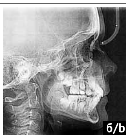
Рис. 7. Данные рентгенологических снимков после лечения: а) ОПТГ; б) ТРГ в боковой проекции Fig. 7. Posttreatment radiographic data: a) panoramic radiograph; b) lateral cephalometric radiograph