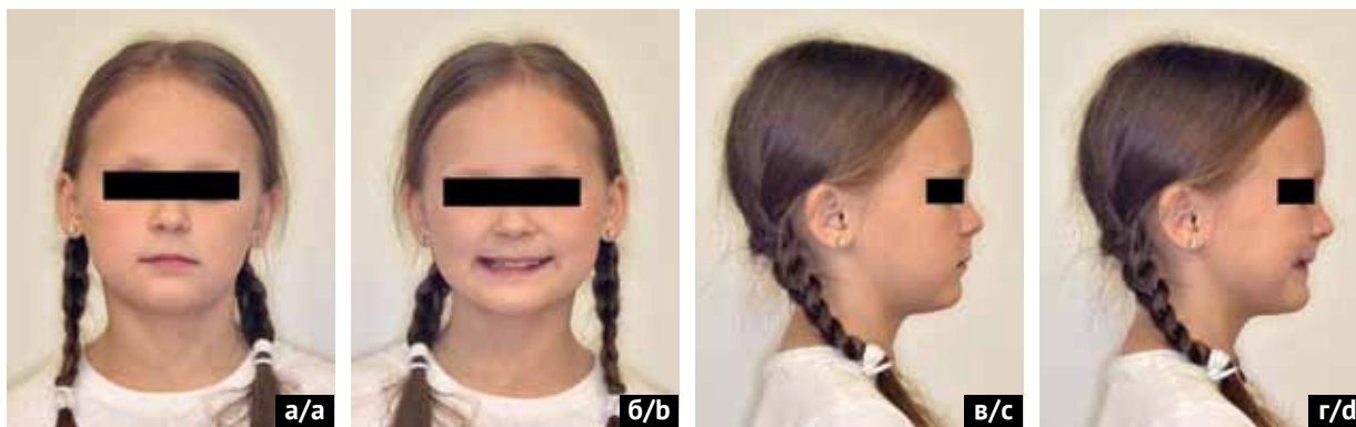
Рис. 1. Фотографии лица пациента до начала лечения: а) фотография лица пациента анфас без улыбки; б) фотография лица пациента анфас с улыбкой; в) фотография лица пациента в профиль без улыбки; г) фотография лица пациента в профиль с улыбкой (источник: составлено авторами)