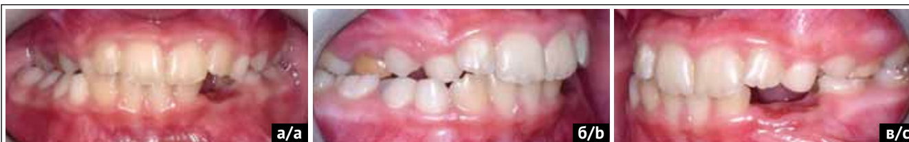
Рис. 2. Внутриротовые фотографии пациента до начала лечения: а) фотография окклюзии во фронтальном отделе; б) фотография окклюзии в боковом отделе справа; в) фотография окклюзии в боковом отделе слева (источник: составлено авторами)