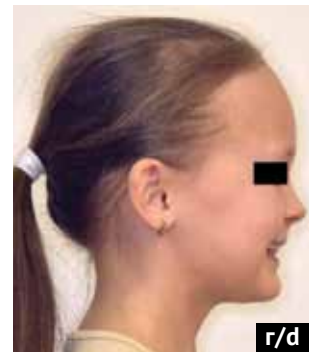
Рис. 6. Фотографии лица пациента после лечения: а) фотография лица пациента анфас без улыбки; б) фотография лица пациента анфас с улыбкой; в) фотография лица пациента в профиль без улыбки; г) фотография лица пациента в профиль с улыбкой Fig. 6. Extraoral facial photographs of the patient after treatment: (a) frontal view at rest; (b) frontal view smiling; (c) profile view at rest; (d) profile view smiling