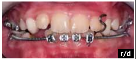
Fig. 4. Intraoral photographs during treatment: (a) fixed maxillary expansion appliance; (b) partial fixed orthodontic appliance on the mandible; (c) anterior occlusion with elastic traction from a Kobayashi hook in the region of tooth 4.2 to the maxillary appliance hook in the region of tooth 6.3; (d) anterior occlusion after 4 months of treatment, with elimination of the functional mandibular shift